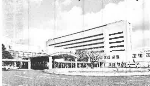
日本海総合病院(山形県酒田市)

Q. オンライン資格確認を導入したことで、業務の内容や流れはどのように変わりましたか。