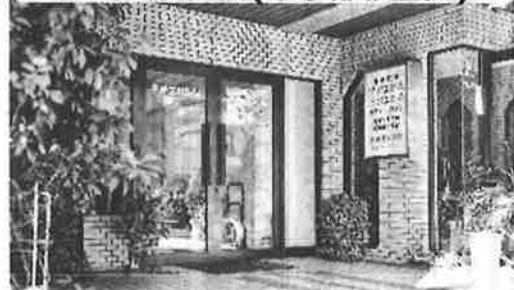
矢嶋歯科医院(東京都杉並区)

A. 保険情報の確認は、これまで目視による健康保険証の確認と手作業による入力で、患者さん1人当たり30秒ほどかかっていた。 顔認証付きカードリーダーを導入することにより、この作業があっという間に済むようになりました。(続きは導入事例サイトへ)