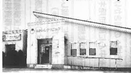
あかいしクリニック(東京都三鷹市)

A. これまでは、医事会計システムに登録した内容について保険証のコピーをもとに目視でダブルチェックしていましたが、 医事会計システムと連携したことにより資格確認の結果を画面上で確認できるようになり、業務の効率が向上しました。(続きは導入事例サイトへ)