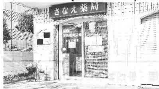
さなえ薬局(東京都足立区)

A. レセプトコンピューター側の価格設定次第ではありますが、それほど高額にはならないのではないのでしょうか。インターネット回線を引く金額とそう変わらないはずですが、 保守費用などが月額負担としてかかるケースもあるようですが、日常業務で発生する細かなトラブルに対応してくれることを考えれば必要な経費だと思います。(続きは導入事例サイトへ)