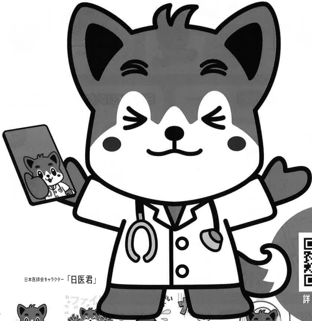
日本医師会キャラクター「日医君」